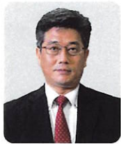
江坂 行弘 (国交省) 自動運転の実現 に向けた国土交 通省の取り組み