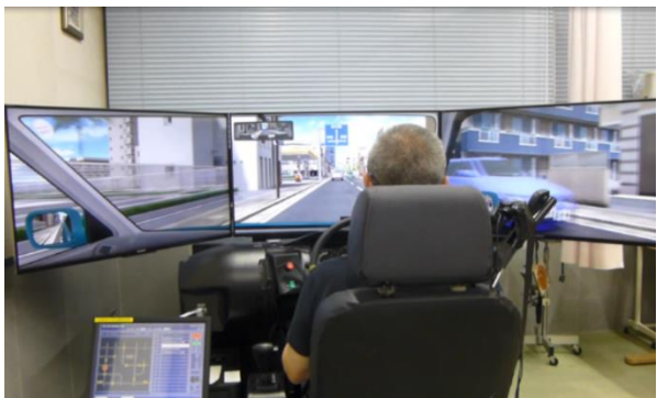
ドライビングシュミレーター